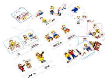
NS1026 Czasowniki: Co robi? Co robią?

4. Opisane powyżej przedmioty niniejszej deklaracji są zgodne z odnośnymi wymaganiami przepisów wspólnotowych dotyczących harmonizacji wymienionymi poniżej / The objects of the declaration described above is in conformity with the relevant Community harmonization legislation bellow mentioned: