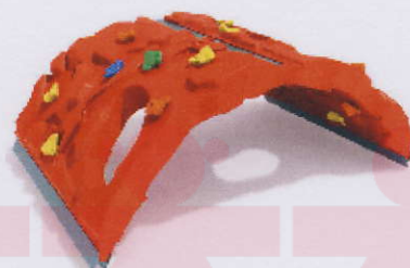
RC0021 ścianka 7