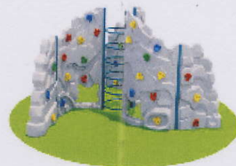
RC0009 ścianka 2