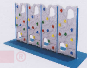
RC0024 ścianka 3