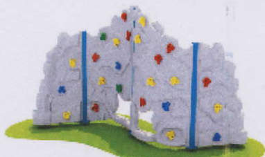
RC0001 ścianka 1

3. Typoszereg o jednakowych właściwościach i nazwa jednostkowa / Series with the same properties and unit name: