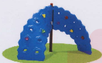
RC0020 ścianka 4