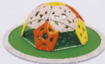
RC0005 ścianka 6