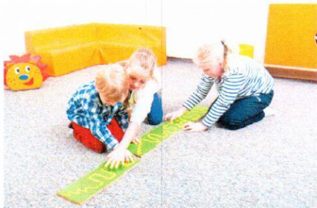
NS0899 Puzzle. Sensoryczne szlaczki szorstkie