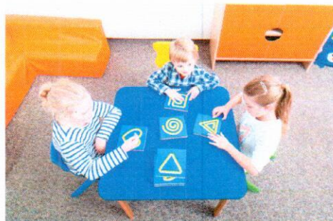
NS0900 Sensoryczne szlaczki szorstkie