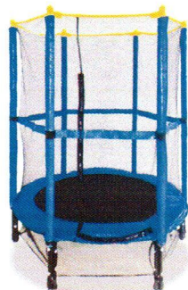
BO1028 Trampolina z ochraniaczem.