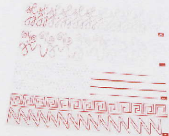
NS3007 szłaczki graficzne zestaw I zielony