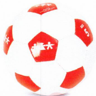
VO0001 piłka nożna