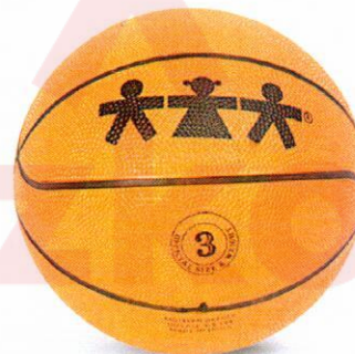
VO0005 piłka do koszykówki3