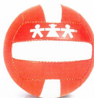
VO0002 piłka do siatkówki1