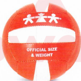
VO0003 piłka do siatkówki5