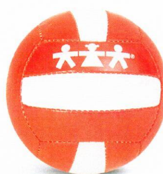
VO0006 piłka do mini siatkówki