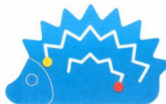
NS1030 manipulacyjny jeź