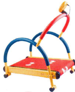
SG0001 Bieżnia 1.